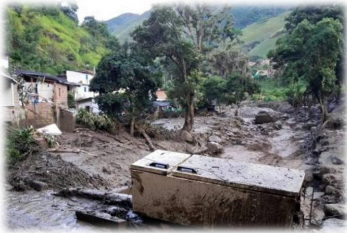
(El Universal, 2015)