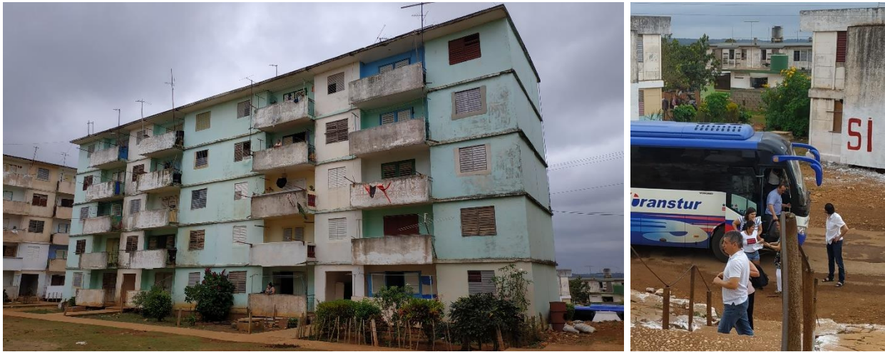
Imagen 1. Modelo típico de edificio multifamiliar hacia donde se reasentaron carahateños de forma involuntaria en Lutgardita, y equipo ADAPTO en el lugar, respectivamente.

los efectos del cambio climático, se deben entender estos antecedentes que ha sufrido la comunidad.