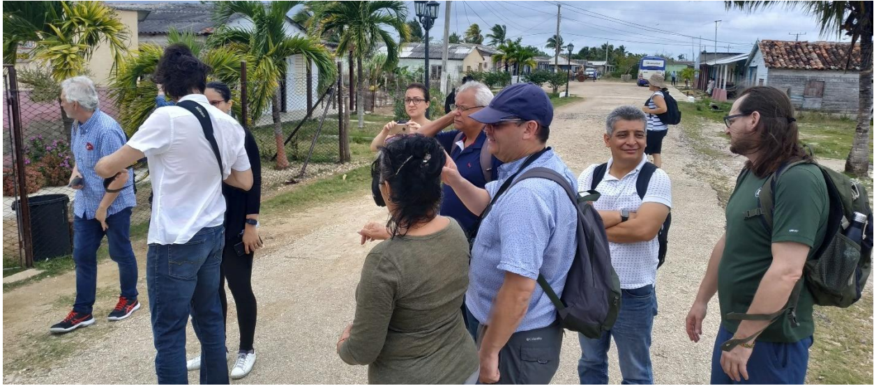
Imagen 2. Investigadores del equipo ADAPTO en Carahatas.