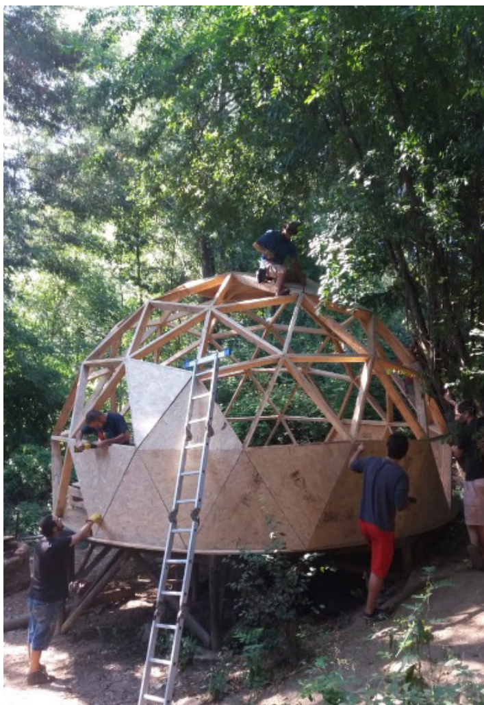
Fig. 8. Instalación de las placas estructurales de madera laminada.

dependencia en una determinada experiencia que, de no existir, dificulta la replicabilidad del proyecto. Las acciones futuras incluyen la instalación de ventanas y una puerta, así como el aislamiento. No obstante, ya se han llevado a cabo con regularidad varias actividades pedagógicas y comunitarias relacionadas (principalmente clases y reuniones).