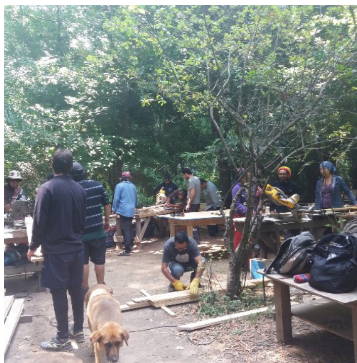
Fig. 5 - 6. Proceso de marcado y corte de piezas entre los fruteros de la escuela. Fuente: Entorno Educador.