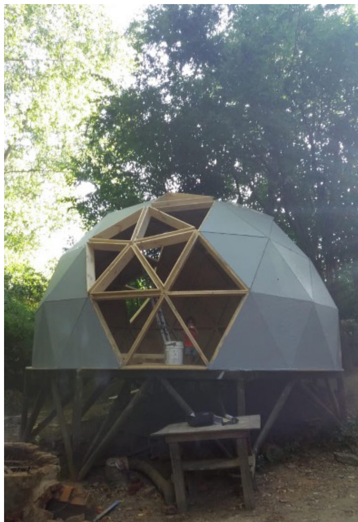
Fig. 9. Placas de madera laminada pintadas con pintura impermeable.