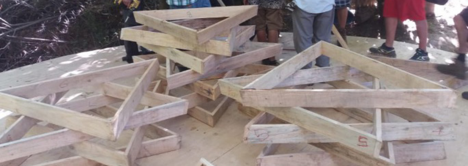
Fig. 3. Proceso de construcción del marco estructural triangular.