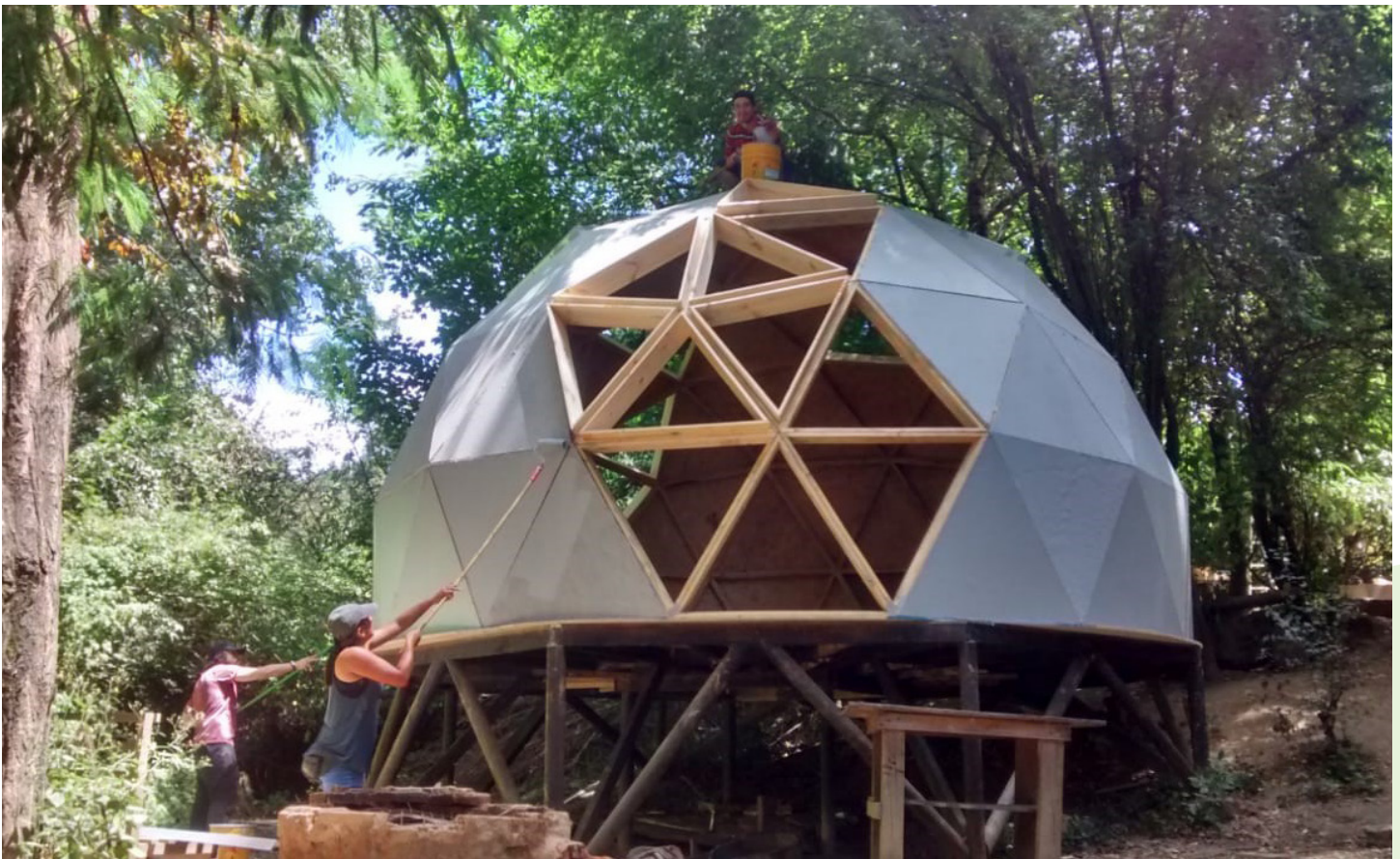
Fig. 2. Construcción del domo.

El domo albergará reuniones, talleres y actividades educativas para niños, jóvenes, profesores y otros miembros de Entorno Educador y de la comunidad de Nongué en general. Estas actividades incluirán talleres sobre terapia forestal y biodetergentes, demostraciones sobre el sistema de recuperación de aguas grises y el huerto comestible, así como clases escolares regulares. Así, la cúpula fomentará la labor educativa y de reflexión sobre la relación de los individuos y la comunidad con el río. A su vez, estas actividades deben promover la revalorización del río como recurso fundamental para la preservación de la biodiversidad local.