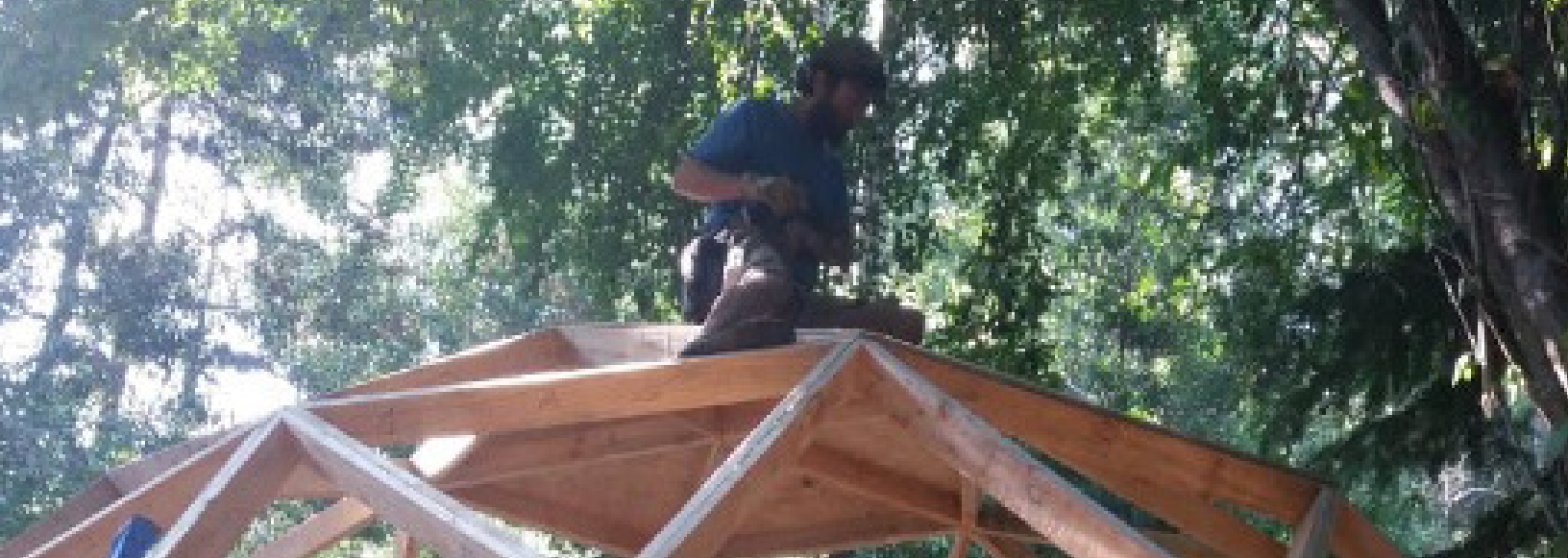
Fig. 4. Instalación de las placas estructurales de madera laminada.