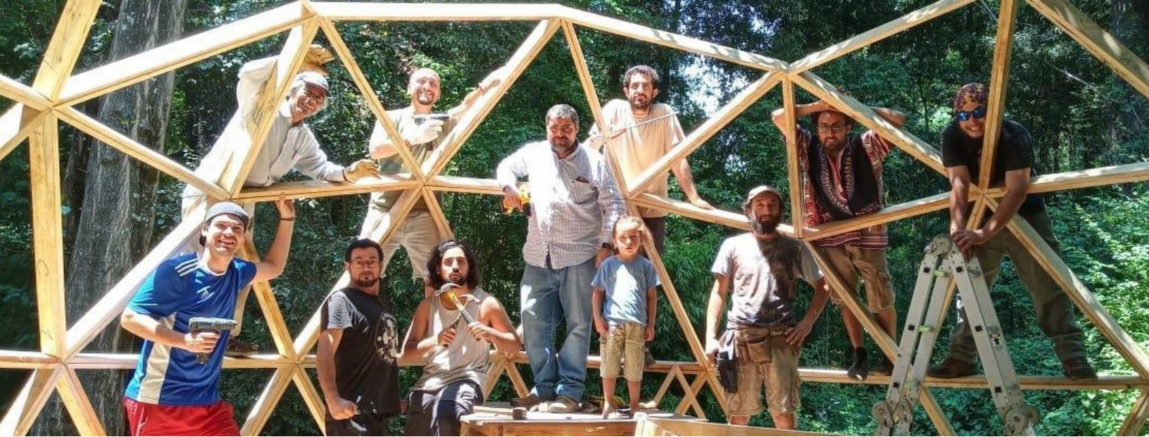
Fig. 1. Construcción del domo por los padres y amigos de la iniciativa pedagógica Entorno Educador.