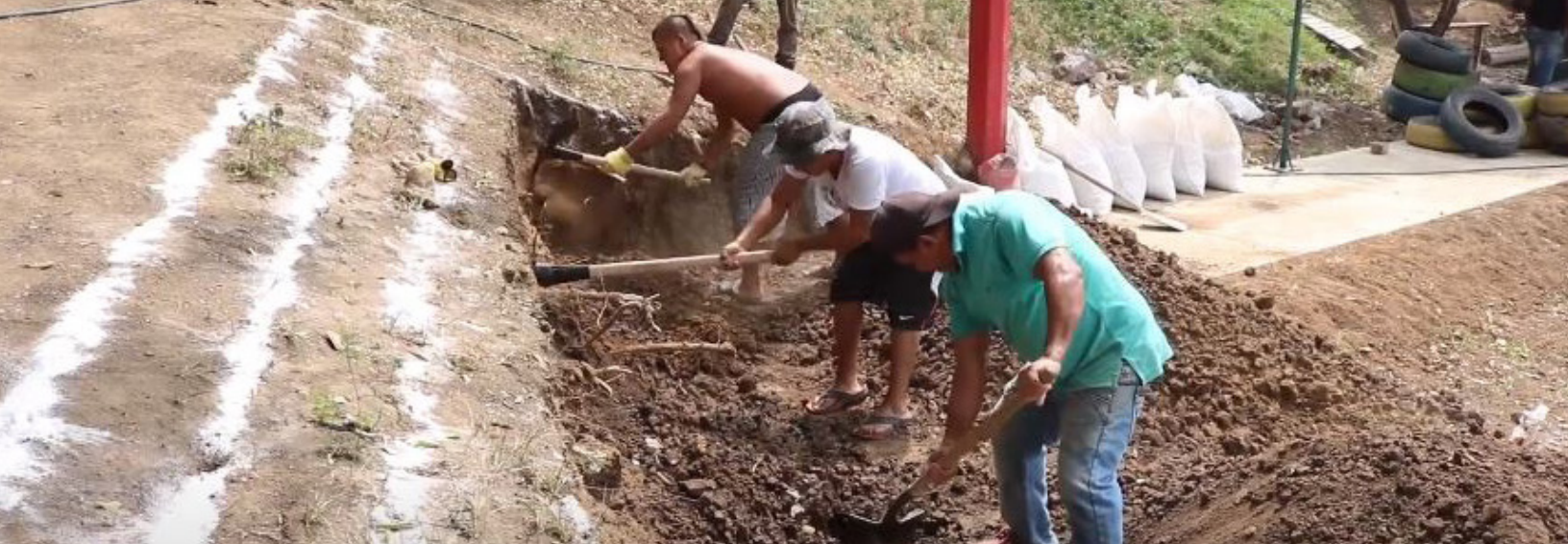
Fig. 4. Construcción del SUDS piloto.