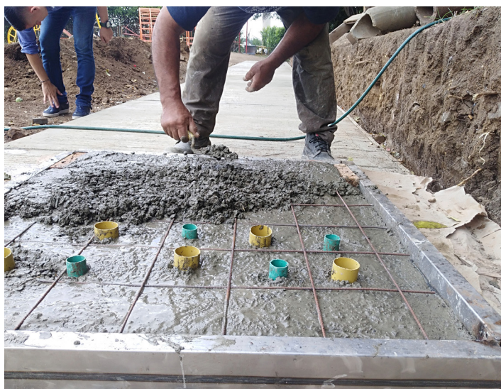
Fig. 5. Tapas perforadas para filtrar el agua de lluvia en los módulos.

La consolidación de múltiples ideas de proyecto en una sola iniciativa también desempeñó un papel importante durante la ejecución del proyecto, ya que facilitó que la comunidad se apropiara del espacio y de sus procesos de gestión. El SUDS no sólo reduce el riesgo de inundación, sino que también sirve como infraestructura recreativa y social. El enorme nivel de organización de la comunidad hizo posible el acceso a recursos adicionales y demostró el poder de movilización de una comunidad en un proyecto multidimensional.