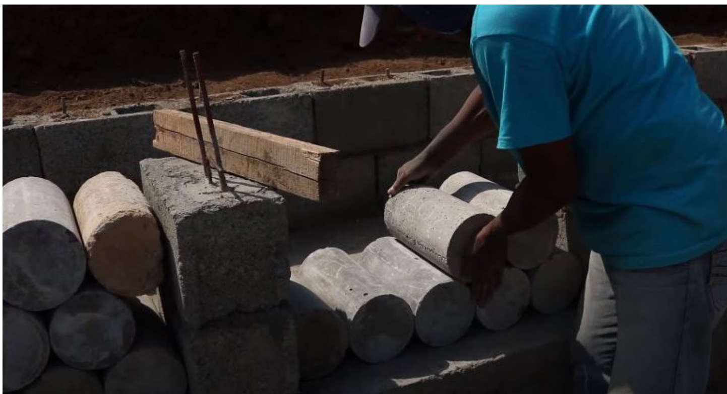
Fig. 8. Proceso de montaje de las cubiertas perforadas de los módulos.

El modelo SUDS también es replicable en modo “hágalo usted mismo”. Se espera que el kit de información que se distribuirá a los residentes les anime a seguir instalando el SUDS en otras zonas de riesgo.