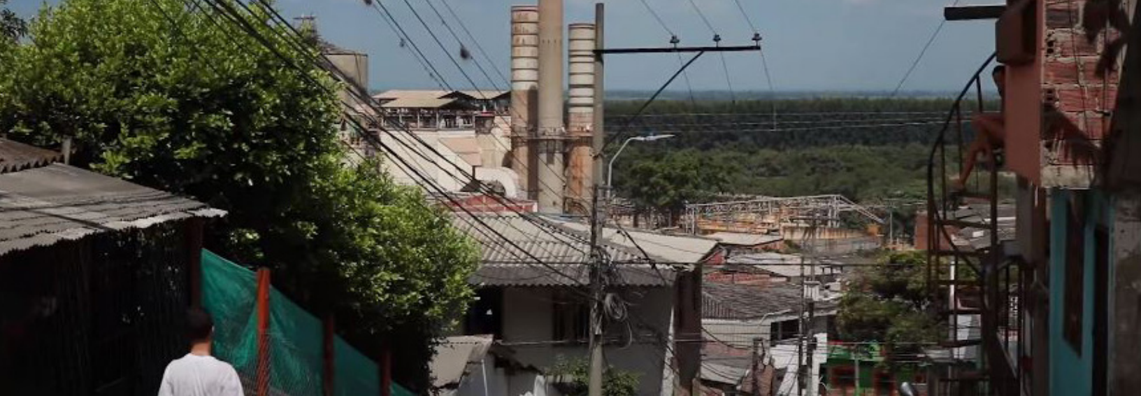
Fig. 7. Barrio Las Américas.