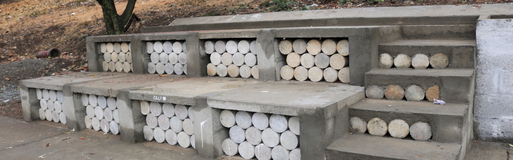
Fig. 1. Construcción del Sistema de Drenaje Urbano Sostenible.