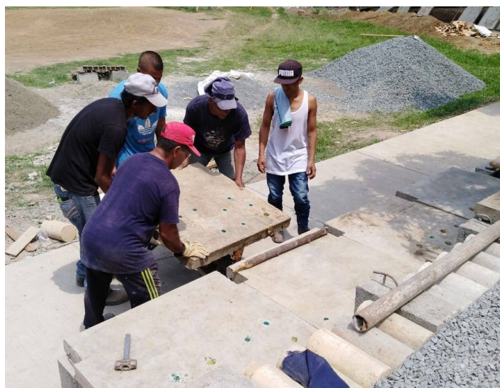
Fig. 6. Proceso de montaje de las cubiertas perforadas de los módulos.