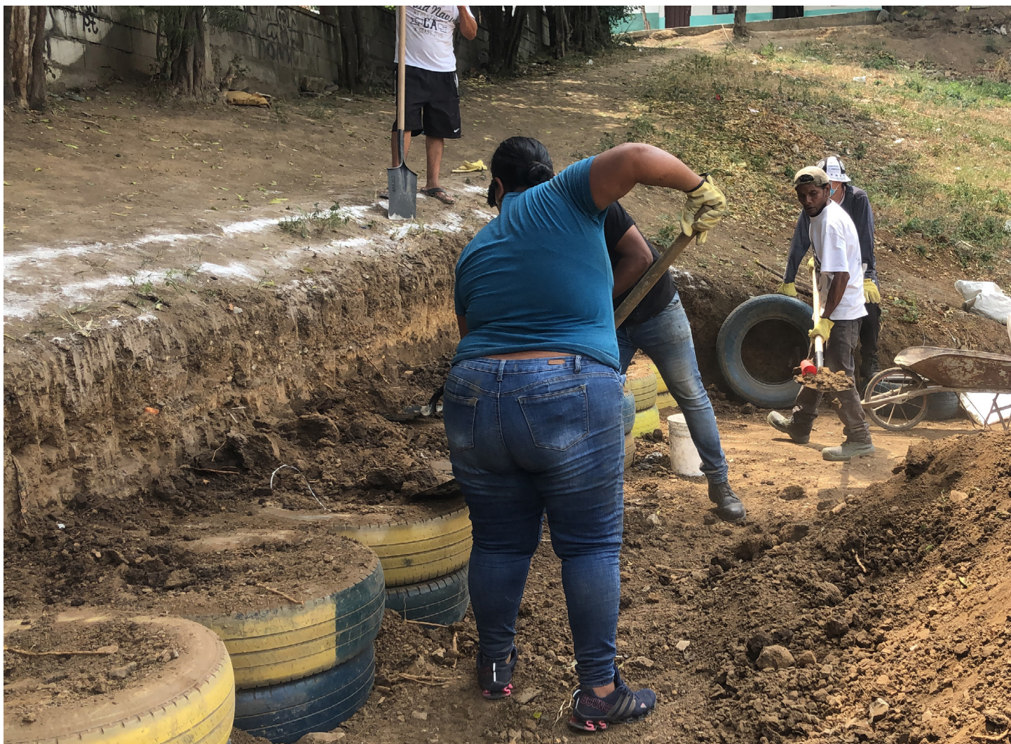
Fig. 2. Construcción del SUDS piloto.

El sector privado también contribuyó notablemente al proyecto. Además de donar el terreno, Cementos Argos proporcionó el cemento. La Alianza Empresarial pagó otros materiales de construcción y ayudó a financiar las actividades recreativas y los talleres. El gobierno local contribuyó al proceso de construcción y consolidación de la propuesta autorizando la construcción de la infraestructura en el parque recién adquirido. También aprobó el uso de maquinaria pesada especializada y el empleo de trabajadores cualificados del municipio.