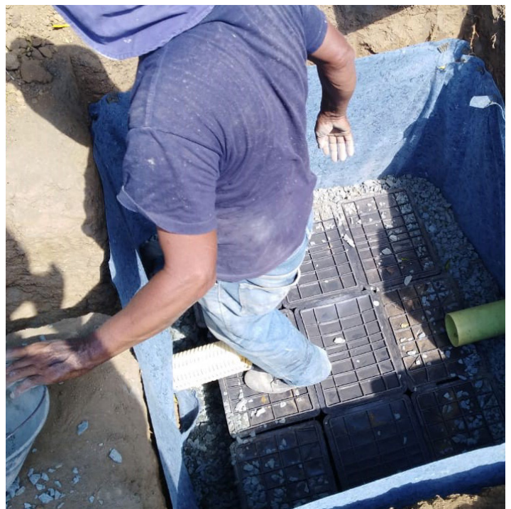
Fig. 3. Imagen que ilustra el proceso.