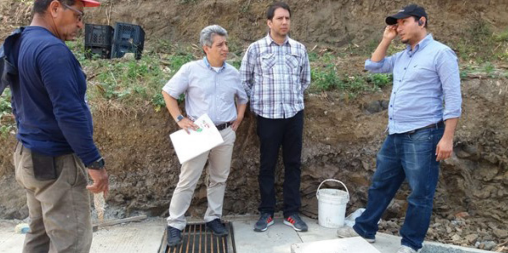
Fig. 4. Evaluación de las estructuras por parte del equipo de investigación. El equipo se sitúa en una trampa de arena situada al final de una de las tres secciones. Foto: C. Villa.