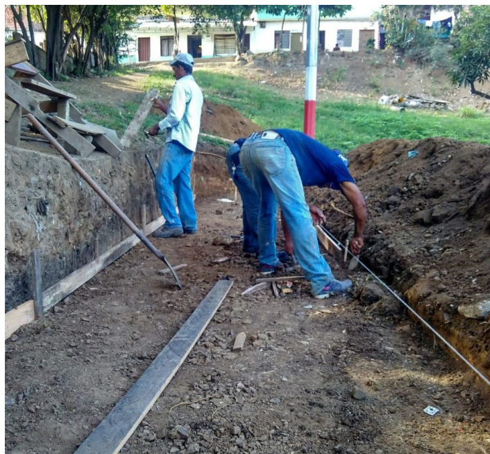
Fig. 5. Imágen que ilustra el proceso.

Cementos ARGOS donó 330 sacos de cemento y Ecodeck donó 32 m 2 de pavimento permeable. La Secretaría de Infraestructura municipal apoyó con la realización de actividades de limpieza y adecuación en el área de intervención, utilizando maquinaria para la adecuación, demolición y remoción de tierra.