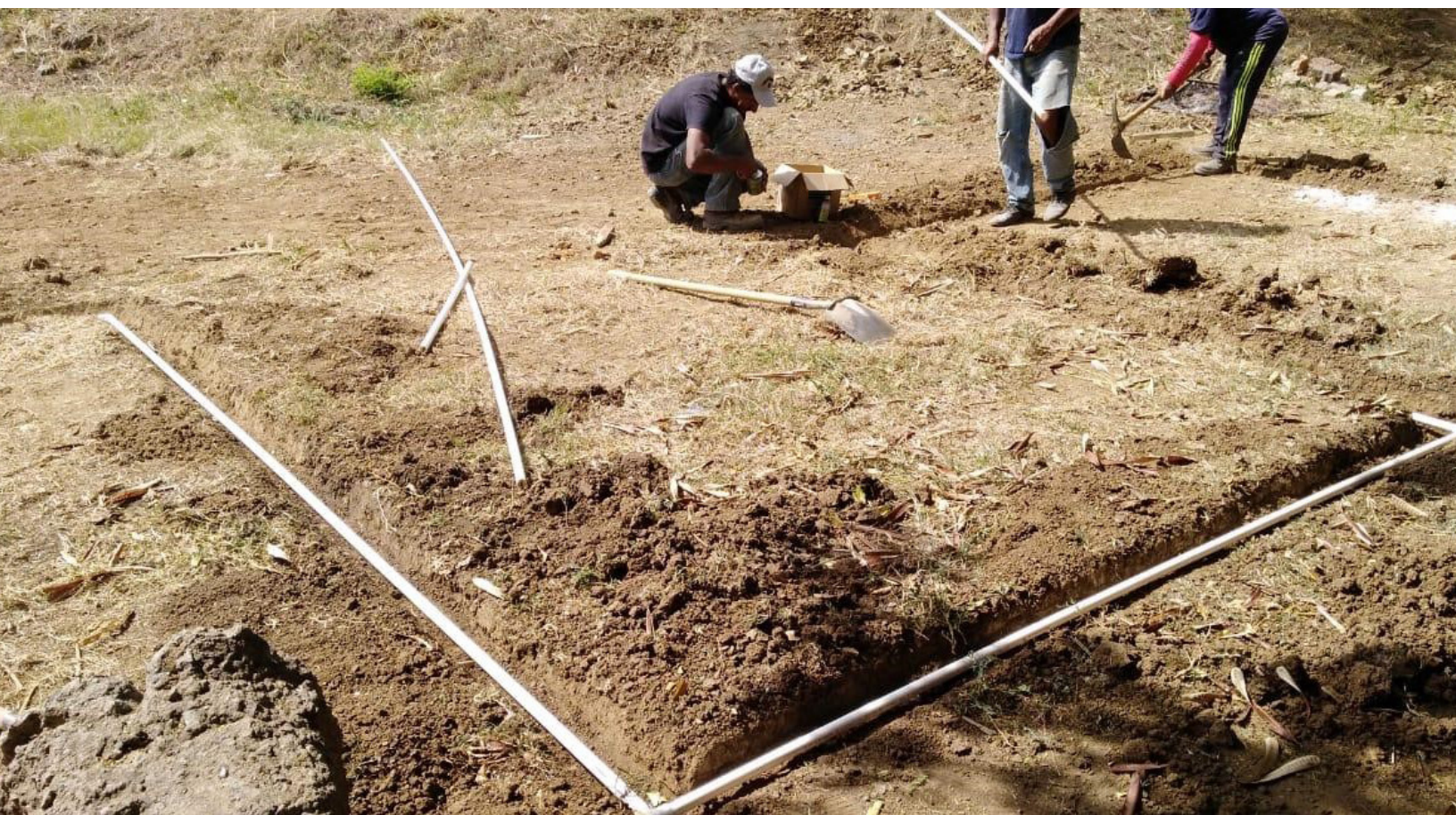
Fig. 7. Imagen que ilustra el proceso.

Se está realizando una evaluación más detallada de la eficacia de la infraestructura. Si la evaluación es positiva, el sistema podría reproducirse fácilmente, ya que puede construirse en diferentes tamaños y para diversos contextos de forma sencilla, económica y sin grandes requisitos técnicos.