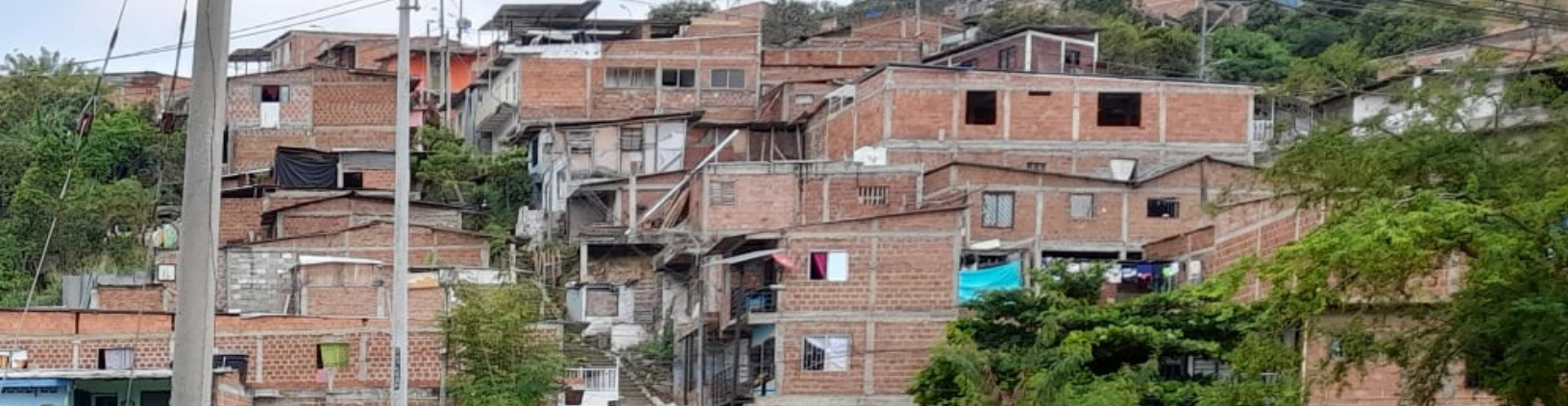
Fig. 1. Paisaje del barrio de Las Américas en Yumbo, Colombia.