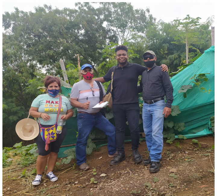
Fig. 4. Reunión del Comité de Dirección de FACY con profesionales de la Universidad del Valle.