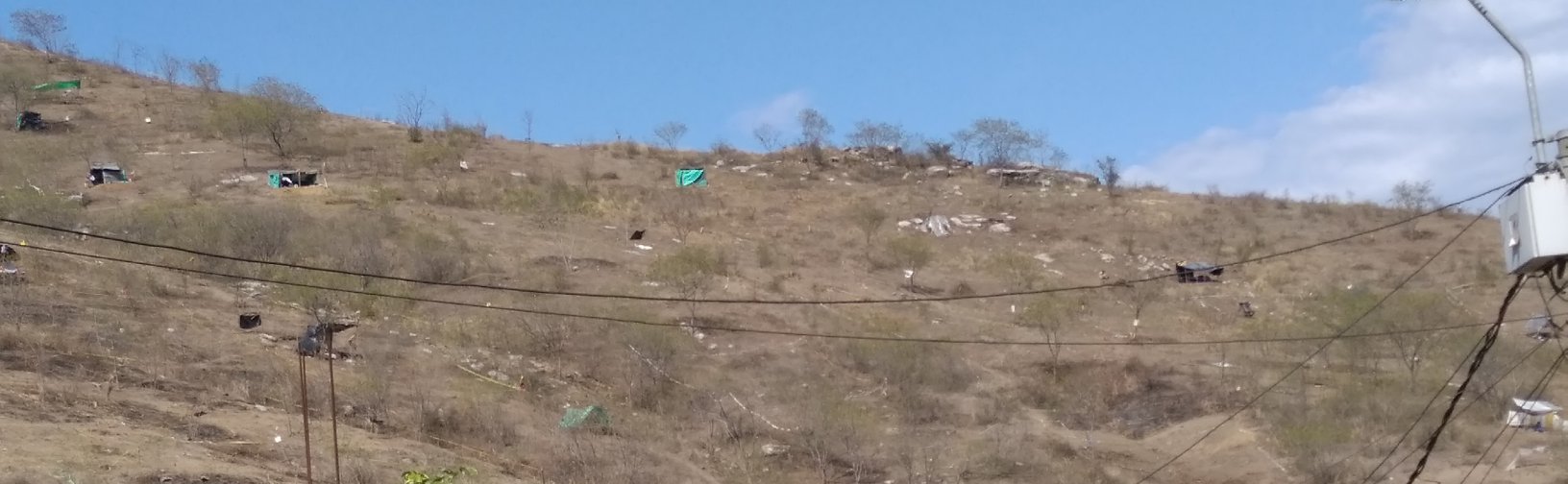
Fig. 8. Parte de la zona deforestada durante julio de 2020.