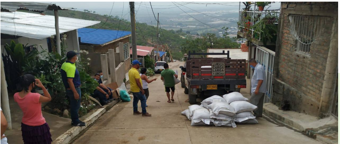
Fig. 2. Entrega de kits para los “Huertos familiares”.

La Fundación FACY organizó tres actividades principales. En primer lugar, ofreció formación a sus miembros sobre jardinería y cultivos domésticos utilizando el enfoque de los “Huertos familiares”. FACY desarrolló este enfoque para producir insumos y plantas en casa que luego pudieran trasplantarse en espacios públicos. En segundo lugar, planificó varias acciones urbanas cerca del arroyo en la Laguna de los Patos y el parque de Las Américas. Entre ellas, se instalaron macetas hechas con residuos sólidos y se construyeron senderos peatonales con demarcaciones y señalización específicas. Para implementar estas acciones, FACY buscó a la Universidad del Valle, a las Juntas de Acción Comunal y al Programa Ambiental de la Secretaría de Educación del Municipio de Yumbo para obtener asesoría técnica y apoyo comunitario. En tercer lugar, la Fundación FACY consultó a los ciudadanos de la zona sobre la importancia de la reforestación en la zona de la quebrada Guabinitas. La Fundación FACY también participó en otras iniciativas de reforestación en barrios cercanos y contribuyó a las sesiones organizadas por la administración municipal sobre temas relacionados con el Plan de Ordenamiento Territorial. Estas actividades permitieron que FACY obtuviera el reconocimiento y la certificación oficial para continuar con el proceso de reforestación más allá del plazo del proyecto de investigación de ADAPTO.