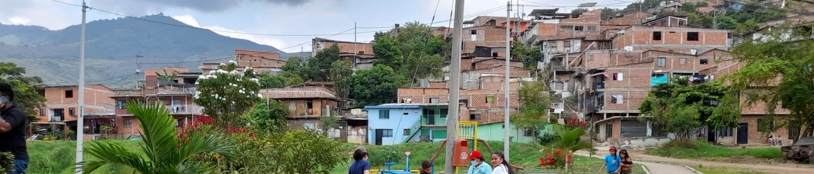
Fig. 1. Panorama del barrio de Las Américas en Yumbo, Colombia. Foto: Camilo Villa (2019).