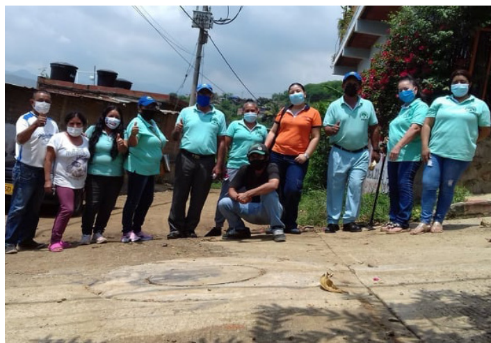
Fig. 6. Reunión del Comité de Dirección de la FACY con profesionales de la Universidad del Valle. Fotos: C. Villa 2020.