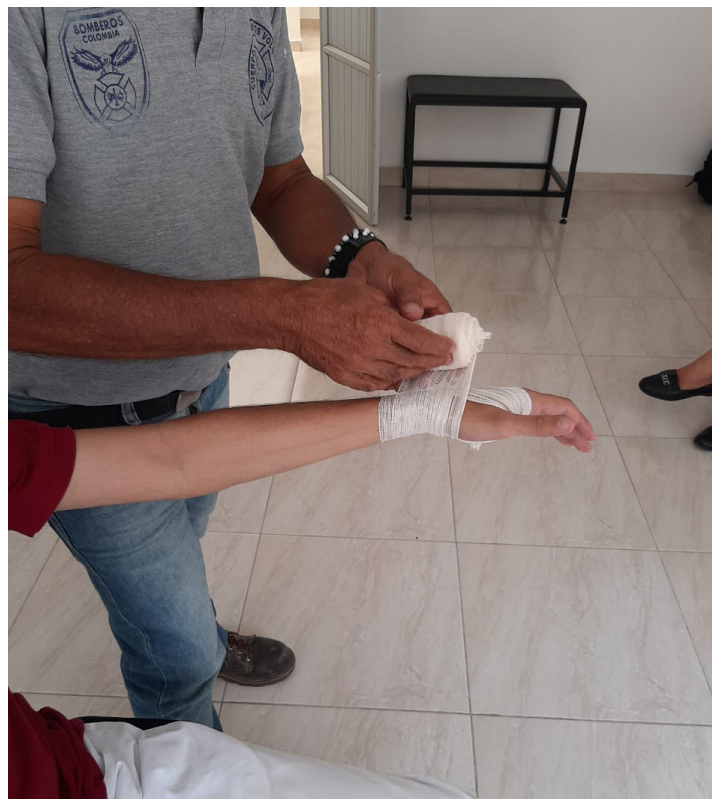
Fig. 10: Formación en primeros auxilios.

La iniciativa se dio a conocer en otros municipios gracias a la participación de socios regionales y al liderazgo de la agente de cambio. A su vez, muchas personas se interesaron por llevar a cabo actividades similares en sus localidades. Dado que la prevención y la gestión del riesgo de catástrofes son relevantes para muchas regiones de Colombia, y de América Latina en general, las actividades y las lecciones de esta iniciativa pueden ser útiles para otras localidades, siempre que se tengan en cuenta las particularidades locales de los riesgos y los recursos.