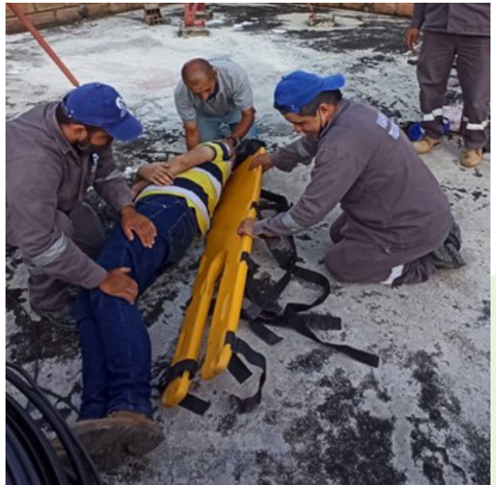
Fig. 2: Formación en primeros auxilios.

De esta colaboración surgieron varias actividades: 25 recicladores y trabajadores recibieron formación del comandante del cuerpo de bomberos sobre primeros auxilios y prevención de incendios (Fig. 2, 3, 4 y 5); 20 residentes con discapacidades físicas y visuales también recibieron formación en primeros auxilios y obtuvieron botiquines de primeros auxilios; 500 hogares recibieron recordatorios para la nevera con información sobre los puntos de encuentro en caso de emergencia en Salgar (también se marcaron en el lugar); y, por último, el canal de televisión ASANPAS y el canal de radio Plateado Estéreo difundieron información sobre las funciones de los distintos actores implicados en la gestión de riesgos en Salgar, como los bomberos y el Consejo Municipal de Gestión de Riesgos y Prevención de Desastres (Fig. 7 y 8).