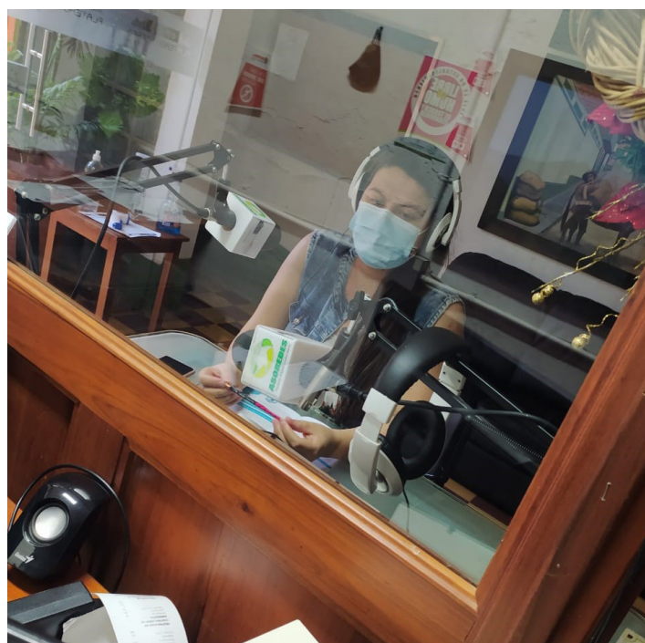
Fig. 7 y 8: Difusión del riesgo de catástrofes en la radio y la televisión. Foto: Cristian Gutiérrez. Captura de vídeo: Programa de televisión de ASANPAS.