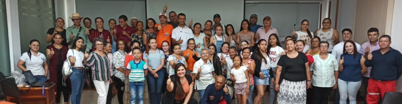
Fig. 1: Reunión inicial con los socios del proyecto y los participantes.