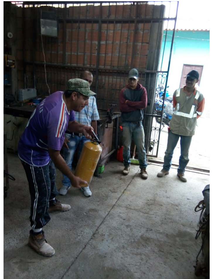
Fig. 3 y 4: Formación en el uso de extintores con recicladores y trabajadores.