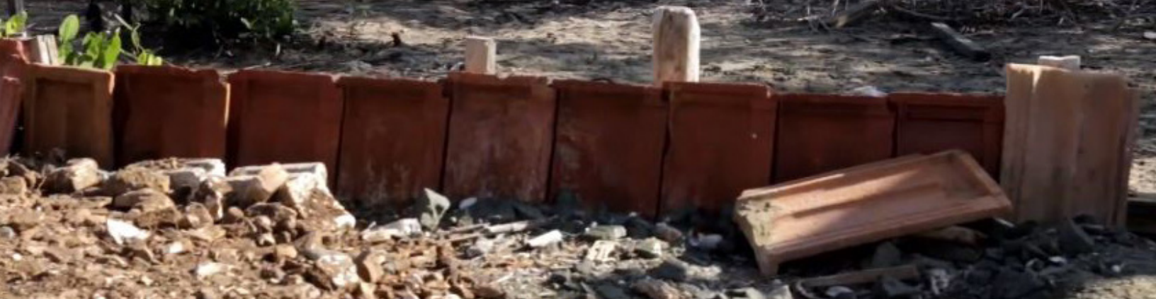
Fig. 5: Espacios en construcción en la comunidad de Carahatas.