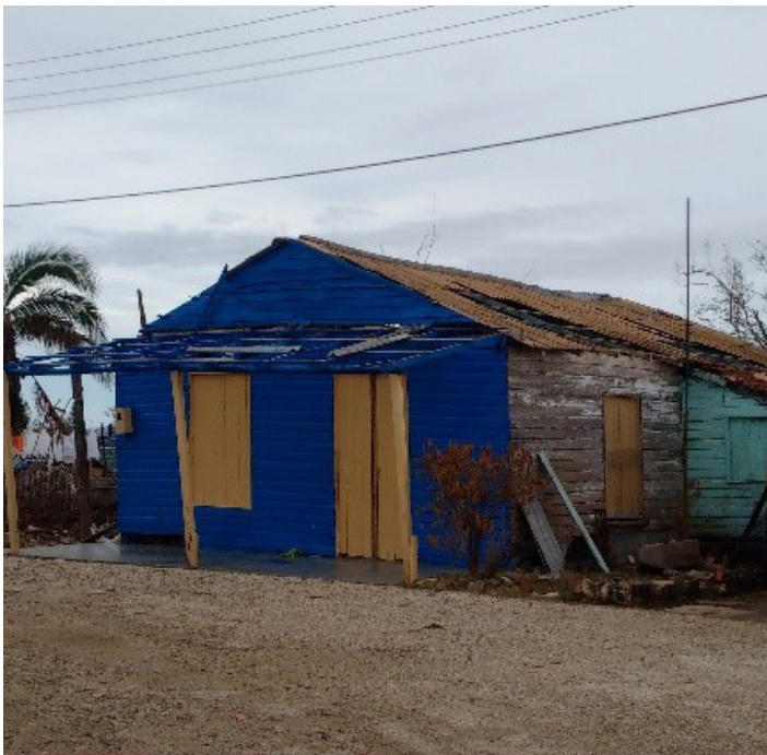
Fig. 11: Casa de madera con daños parciales tras el huracán Irma.

En el modelo cubano de hacer partícipe al Gobierno municipal en una iniciativa enteramente local, ha permitido lograr la legitimidad y sostenibilidad y obtener apoyo técnico profesional, sin afectar la autonomía y el protagonismo social de la iniciativa.