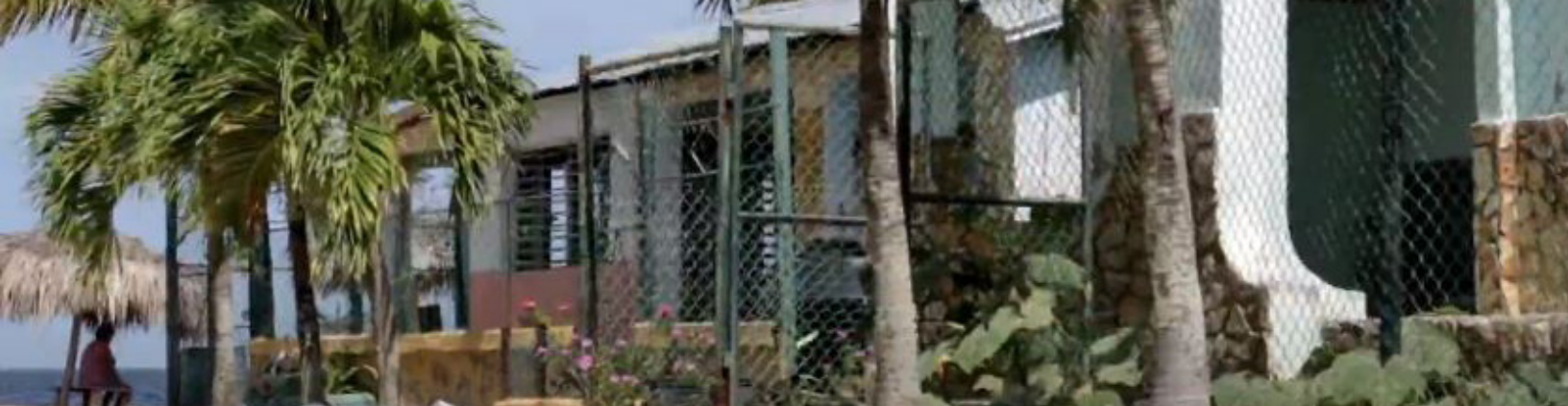
Fig. 6: Edificaciones de Carahatas.