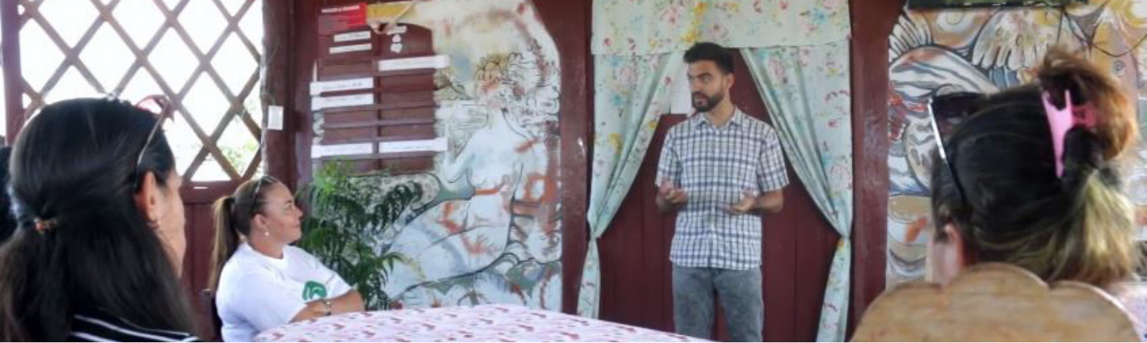
Fig. 10: Reuniones con las mujeres de la comunidad de Carahatas.