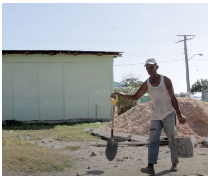
Fig. 8: Habitante de Carahatas en proceso de construcción.