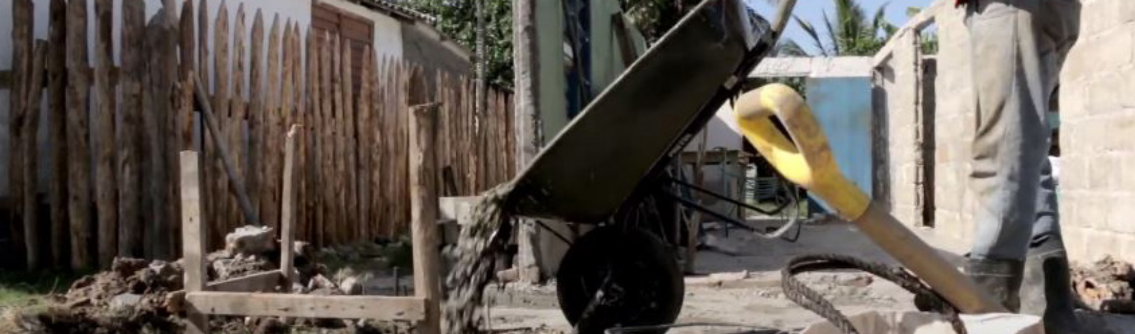
Fig. 13: Vivienda en construcción en la comunidad de Carahatas.