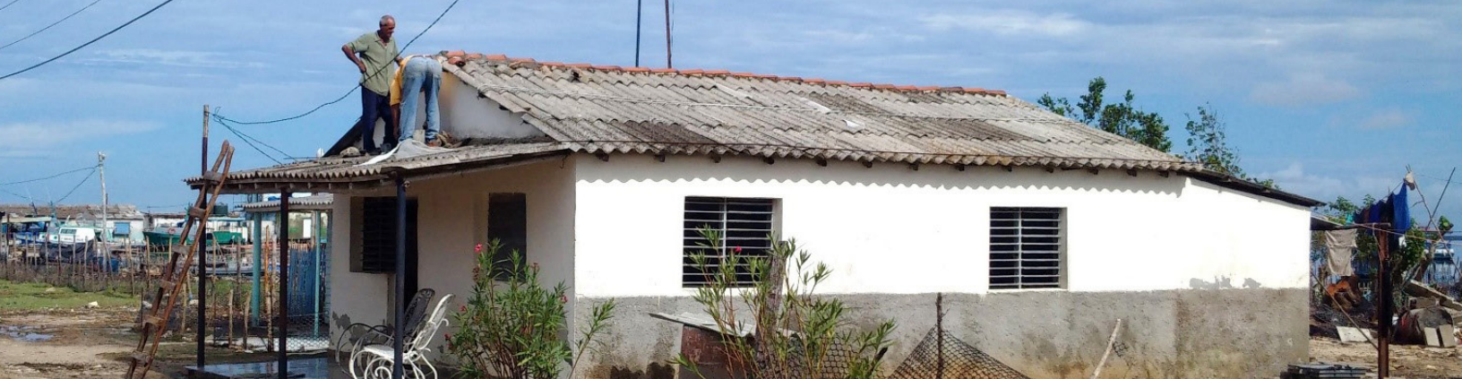
Fig. 1: Labores de reforzamiento de la cubierta ante futuros huracanes.