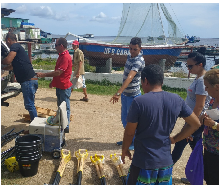
Fig. 7: Entrega de herramientas a la comunidad para la creación del “depósito colectivo”.

Otras entidades, como el Ministerio de Ciencia, Tecnología y Medio Ambiente (CITMA) y el Departamento Municipal de Planificación Física (DMPF), han contribuido a la formalización legal del microproyecto y esperan los resultados finales para su divulgación y posible replicabilidad.