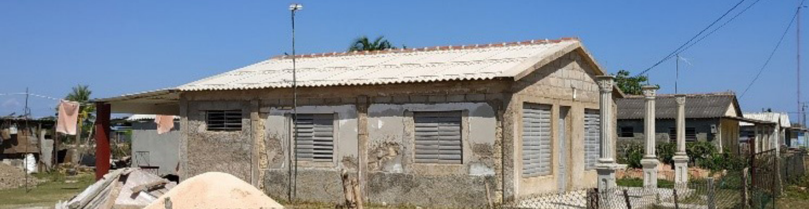
Fig. 2: Vivienda mejorada con refuerzo estructural, pisos elevados y estructuras de porche separadas.