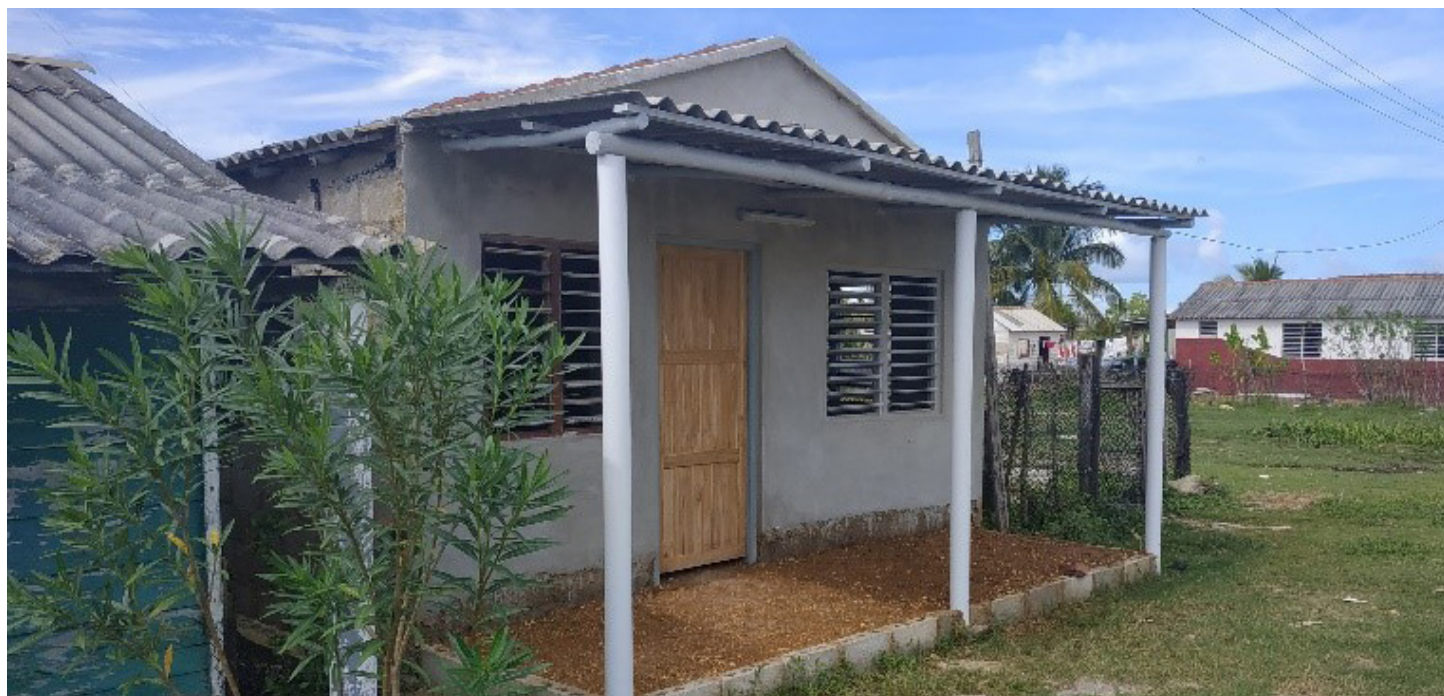
Fig. 14: Vivienda en la que se intervino como parte del microproyecto.

El equipo de la universidad está preparando un artículo y una presentación de los proyectos ADAPTO, para presentarlos en la convención internacional de la UCLV en 2021.