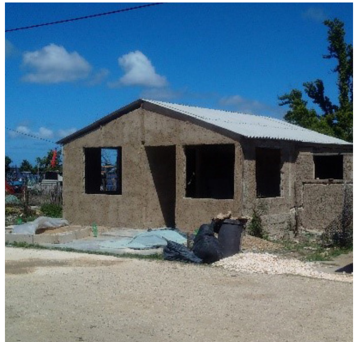
Fig. 12: Misma vivienda mejorada por refuerzos estructurales y fijación del techo.