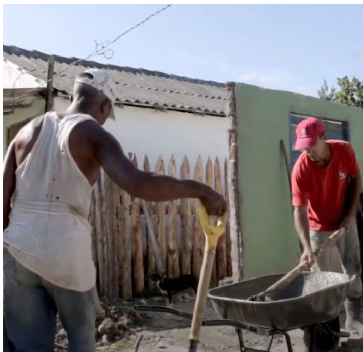
Fig. 3: Comunidad de Carahatas en procesos de construcción.

El segundo fue poner a disposición de la población herramientas de construcción que promovieran la autonomía y permitan bajar los costos de la mano de obra, fortaleciendo la cooperación entre vecinos, la asistencia y la participación de las mujeres y los grupos más vulnerables en las actividades de construcción.