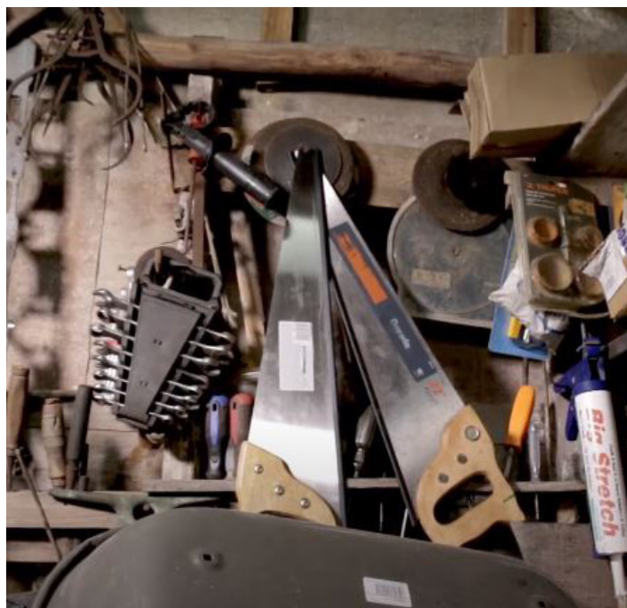
Fig. 4: Herramientas pertenecientes al “depósito colectivo”.